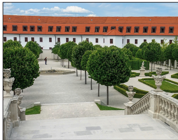
DNES: Pohľad na to isté miesto. Na zábere je baroková záhrada, pod ňou sú garáže.

no leto. Pred plátom bolo aj obrovské javisko, na ktorom sa konali estrádne programy. Ani sa mi už veriť nechce, že som tam videl živého Vlastu Buriana. Vystupoval s klaviristom, spieval a rozprával. Moja generácia zažila v hradnom amfiteátri ešte aj