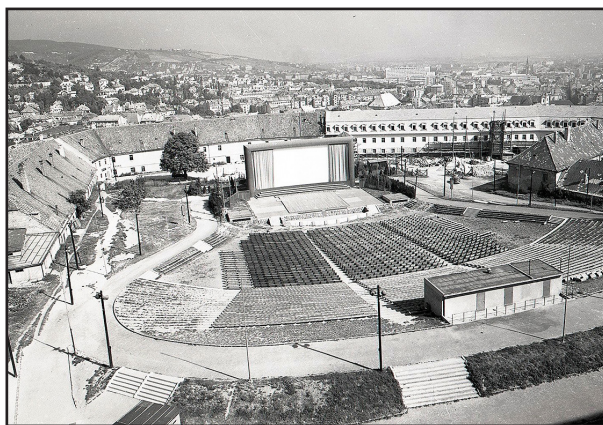
Amfiteáter otvorili v máji 1949, postavili ho na severnej terase Bratislavského hradu.

Bratislavské noviny uverejnili v roku 2007 aj takúto spomienku Jula Satinského: „Na hradný amfiteáter sa chodilo ešte dlho po roku 1950. Tu sme videli Fanfána Tulipána, Pád Berlína aj Tancovala jed-