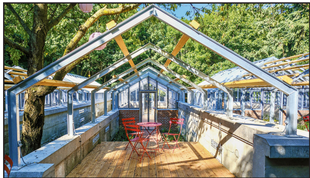
Predná časť skleníkov je oddychová, zadná slúži na komunitné záhradkárčenie.

Záhrada, ktorú koncom 19. storočia vytvorila známa hotelierska rodina Prügerovcov, bola dlhé roky bez systematickej údržby, čo sa podpísa-